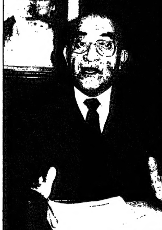
مدير مركز الديبلي